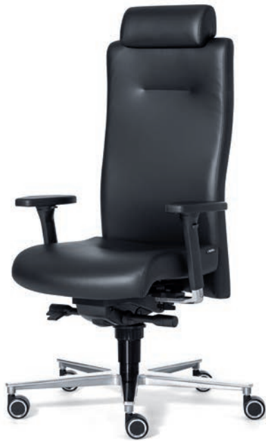
4030 EB NEXT