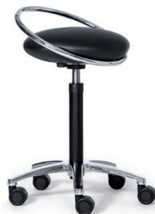
3850 kunstleder carbon look