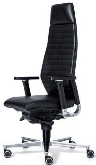
6070 EB NEXT

Transparant vormgegeven en gemaakt voor een optimale zithouding. De mogelijkheid om te kiezen tussen een comfortsynchroontechiek en een ERGO BALANCE techniek maakt de ROVO R12 de perfecte keuze voor iedere werkplek. De ERGO BALANCE 3D-techniek stimuleert impulsief dynamisch zitten. "Bewegend zitten" is uitermate gezond voor lichaam en geest. Ergonomie en design vinden de perfecte balans in deze zeer fraaie bureaustoel. De ROVO R12 past perfect in een moderne kantooromgeving en sluit goed aan bij het huidige kantoormeubilair. Tevens is deze serie voor 98% recyclebaar.