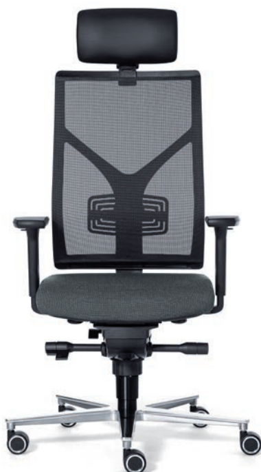
3040 EB NEXT