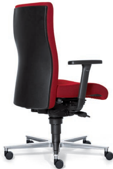
4045 EB NEXT met kunststof rugschaal