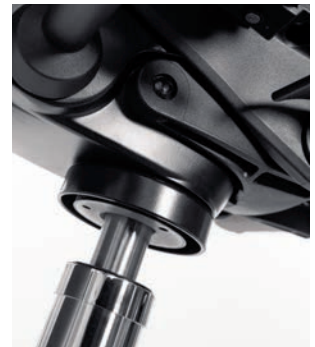
Foto rechts: ERGO BALANCE NEXT, het bewegingsmechaniek van de nieuwste generatie is dé oplossing voor individueel zitcomfort. Binnen een kwartslag draaien van de NEXT module is het ERGO BALANCE mechanisme in- of uit te schakelen. Van synchroon mechaniek naar impulsief dynamisch zitten binnen één handomdraai. Hiermee is de NEXT module een waardevolle optie voor de projectenrichtingsmarkt.