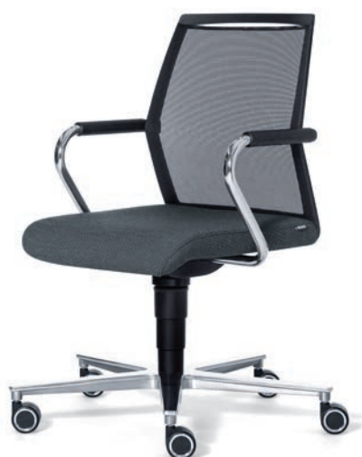
3250 A EB

De ROVO R16 is opvallend, dynamisch en veelzijdig. Een stoel met de X-factor. Met deze stoel hebben we bij ROVO een bureaustoelenprogramma op de markt gebracht die volledig voldoet aan de huidige vraag. Technisch vooruitstrevend, door gepatenteerde technieken, laten we de concurrentie achter ons. Tevens introduceren we met de R16 prijstechnisch een interessante zitoplossing. Natuurlijk speelt het frisse design met fraaie details in combinatie met het gemakkelijk gebruik en hoge comfort een grote rol in het succes van deze serie. Het model alsmede de functionaliteit heeft geresulteerd tot de German Design Award Winner 2019.