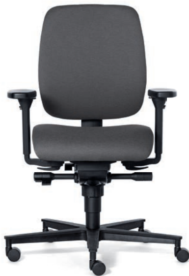
1050 EB NEXT

Zoekt u niet de nieuwste designtrends, maar wel bewezen robuuste begeleiders van uw werkdag? Klassieke schoonheid voor universele toepassingen? Dan zit u bij de ROVO ECO goed! Ruime kussens, een synchroon mechaniek, individuele instelmogelijkheden en een tijdloos design. Al met al heeft deze stoelenserie veel te bieden. Ook deze serie bureaustoelen is leverbaar met het ERGO BALANCE mechaniek, waarmee u nog meer bewegingsvrijheid creëert tijdens het zitten. Deze techniek biedt naast de traditionele synchroon beweging ook de mogelijkheid om zijwaarts te bewegen. Zo optimaliseert u zelf de belastbaarheid van uw wervelkolom tijdens het zitten. De stoel is standaard voorzien van een in hoogte verstelbare rug met optioneel een oppompbare lende/lumbaal steun. De ROVO ECO is al jaren het antwoord op de vraag of ergonomie ook betaalbaar kan zijn. De stoel is opgebouwd met eerste klas kunststoffen, metalen en stoffen.