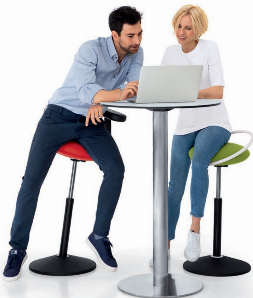
3810 met monopad