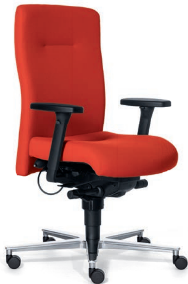
4015 EB NEXT

De ROVO XP is naast de normale versie ook uit te voeren met een diepere of korte zitting die, in combinatie met de aangepaste gasveren voor de hoogteverstelling, zeer geschikt zijn voor lange en korte mensen. Welke toepassing u ook nodig hebt, de uniforme uitstraling van het kantoor blijft hetzelfde.