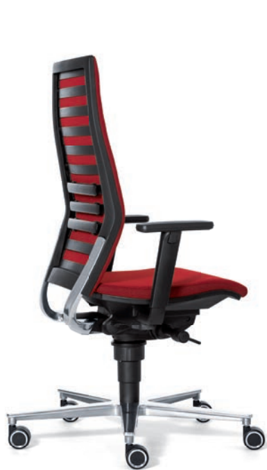
6060 EB NEXT

DESIGN MEETS ERGONOMIE SLANKER, LICHTER EN ACTIEVER