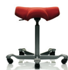
HÅG Capisco 8105