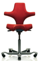
HÅG Capisco 8106