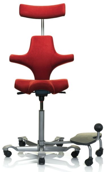
HÅG Capisco 8107/ optie HÅG StepUp®